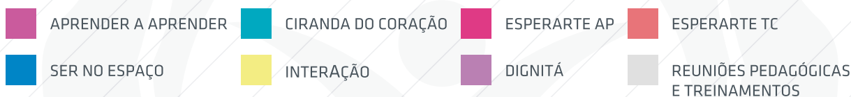
HORAS DE AULA POR PROGRAMA TOTAL: 1.900 h/a

O primeiro semestre de 2012 veio cheio de novidades na OMCV. Com os programas multidisciplinares implantados com sucesso e as parcerias já bem estabelecidas no ano de 2011, a OMCV pôde avançar ainda mais. Houve a ampliação das parcerias, possibilitando a implantação de mais turmas. O Projeto Compaixão passou de 12 para 48 educandos atendidos, e o Projeto CCEE também está ampliando o atendimento no turno da manhã. Ambos os projetos contaram com o apoio da OMCV, que ampliou seu atendimento multidisciplinar, incorporando mais programas a grade das instituições. O programa Dignitá, de assistência social, um dos alvos para 2012, foi iniciado em abril nos projetos Reconstruir e CCEE. Visando integrar as famílias ao processo de capacitação dos educandos, o Dignitá trabalha lado a lado com os psicólogos do Ciranda do Coração para potencializar essa integração. O projeto Esperarte foi enriquecido com o Teatro Criativo e teve, como os demais programas especializados da OMCV, aumentada sua participação na grade das instituições. O projeto Aprender a Aprender finalizou o PEI com as primeiras turmas, que haviam sido iniciadas em 2011, com resultados surpreendentes. O caminho pode ser longo, mas continuamos motivados e seguindo em frente.